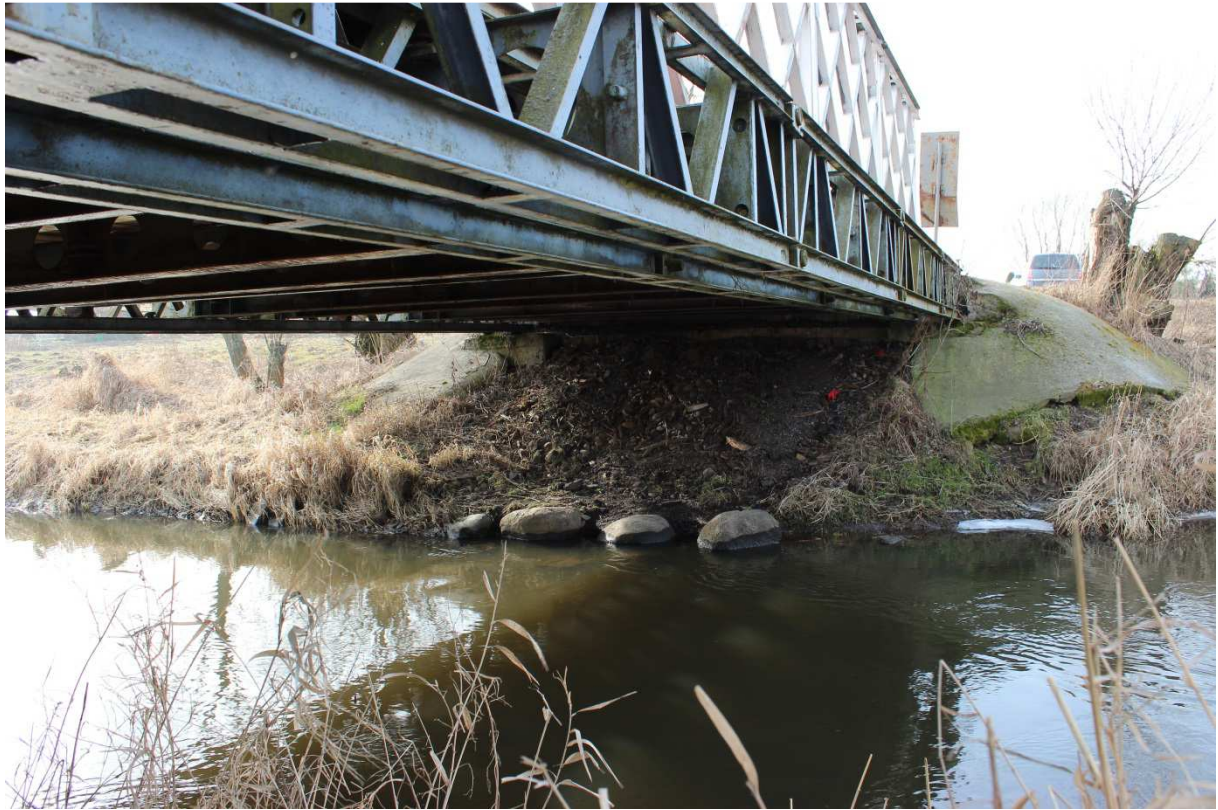
Fotografia nr 7 - Widok od strony północnej - na lewy brzeg