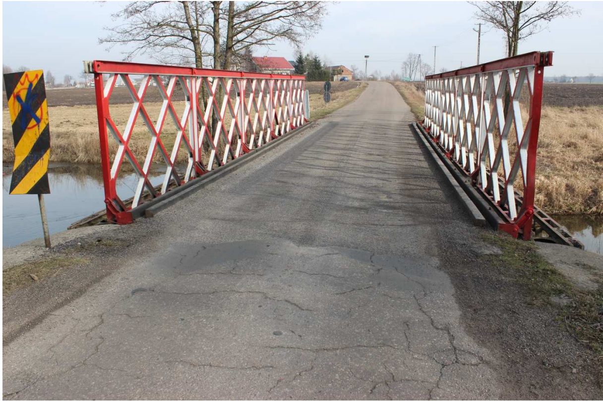
Fotografia nr 9 - Widok na obiekt - w stronę Kisielewa