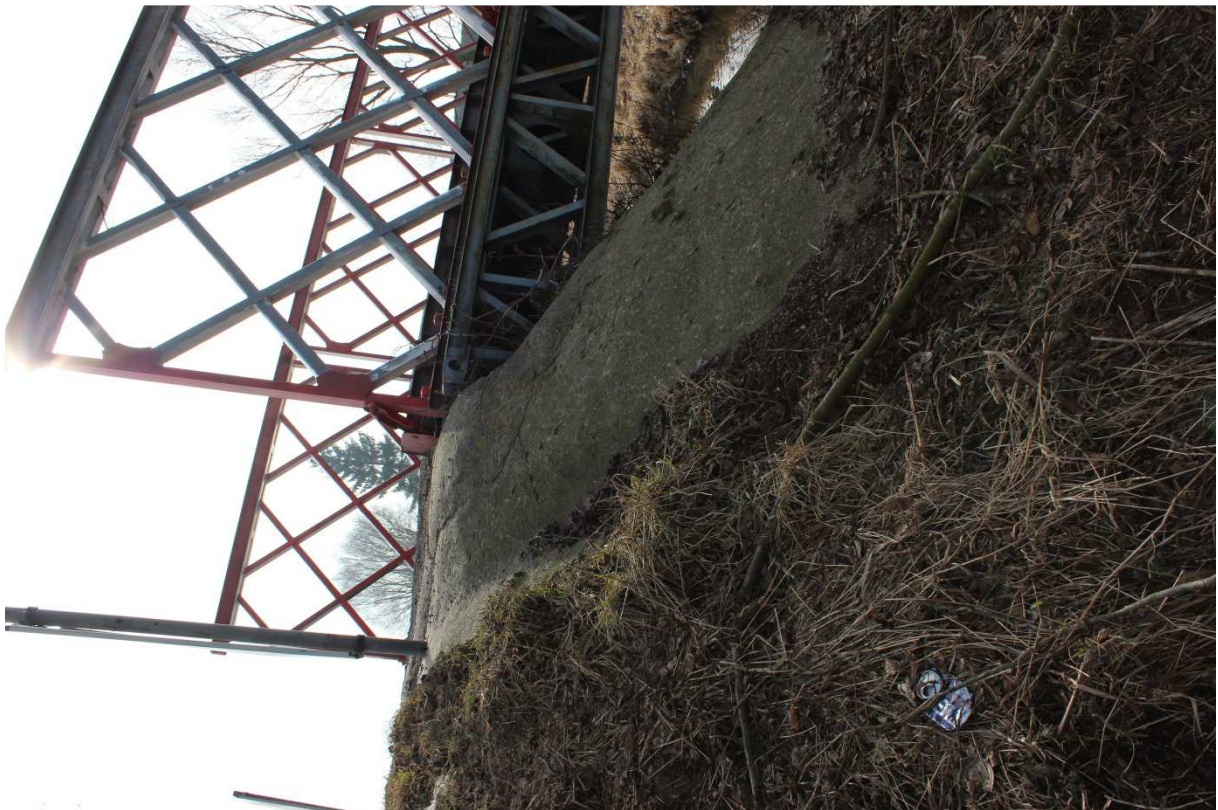
Fotografia nr 8 - Widok od strony północnej - na prawy brzeg