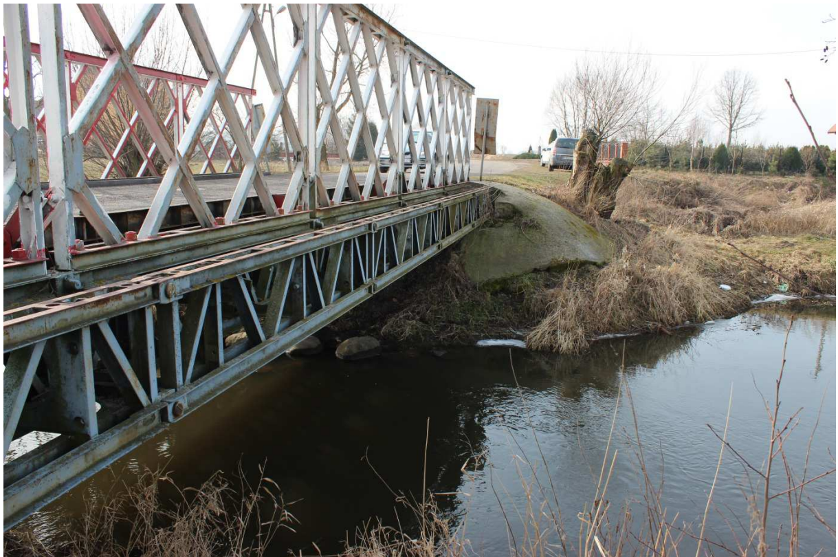
Fotografia nr 6 - Widok od strony północnej - na lewy brzeg