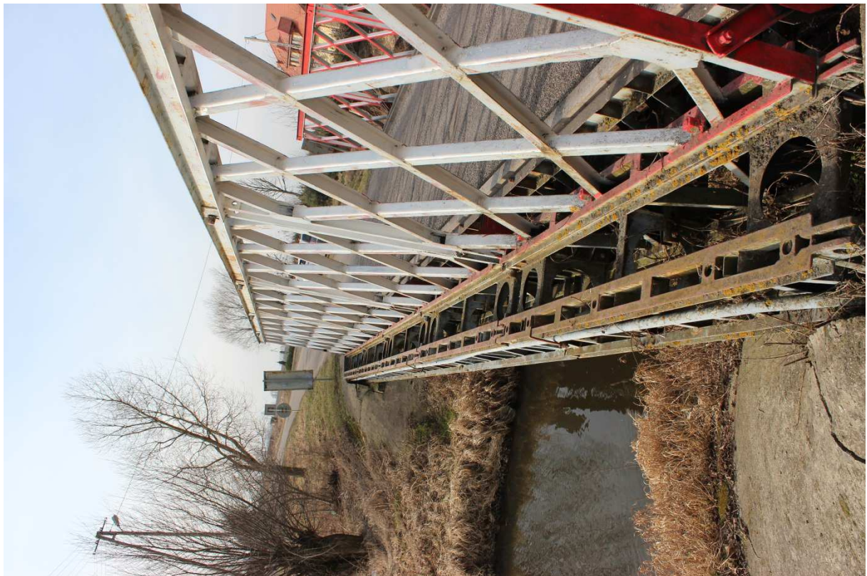
Fotografia nr 4 - Widok od strony południowej - na prawy brzeg