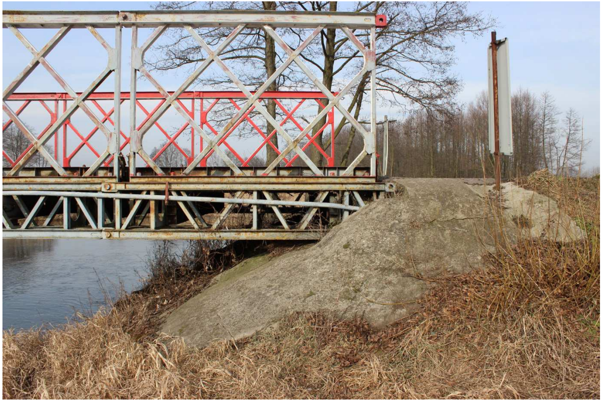
Fotografia nr 3 - Widok od strony południowej - na prawy brzeg