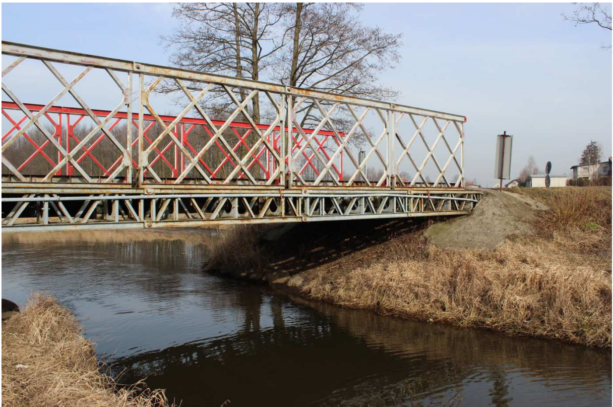
Fotografia nr 2 - Widok od strony południowej - na prawy brzeg