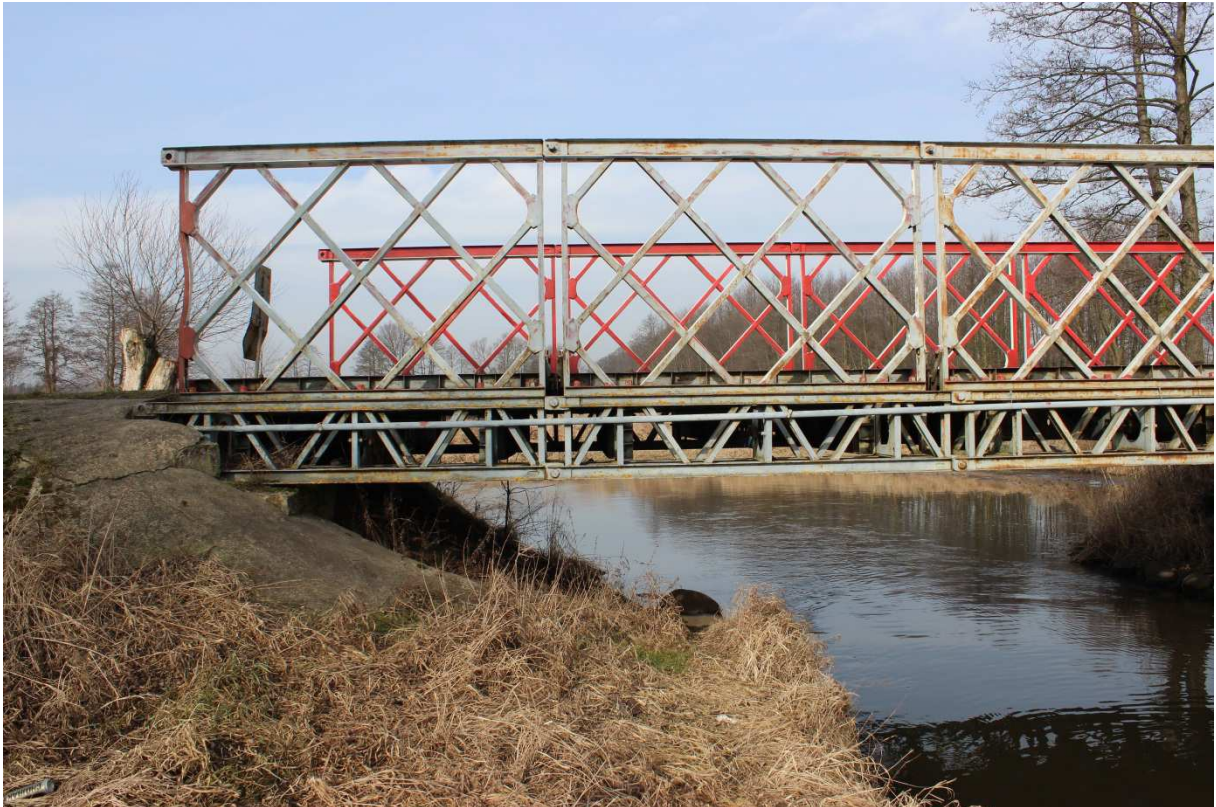
Fotografia nr 1 - Widok od strony południowej - na lewy brzeg