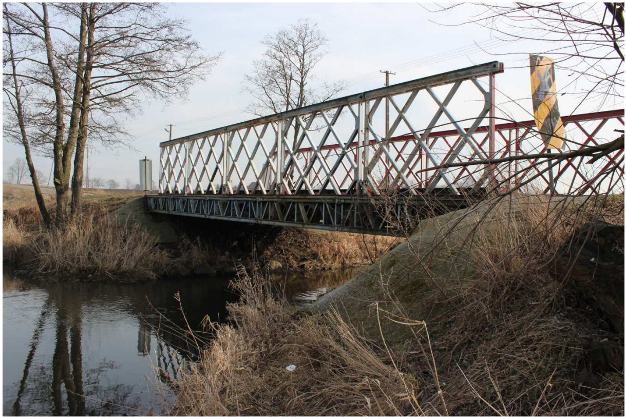
Fotografia nr 5 - Widok od strony północnej - na lewy brzeg